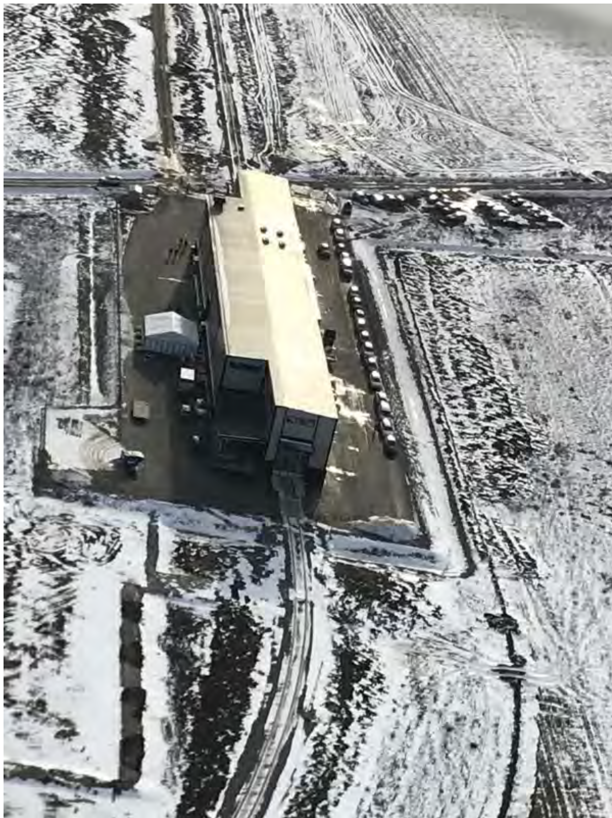
Bild 10. Vy från ovan tagen av en av gästerna som kom med helikopter från Stockholm.

Invigning av Tågserviceanläggningen i Hallsberg 2018-02-15