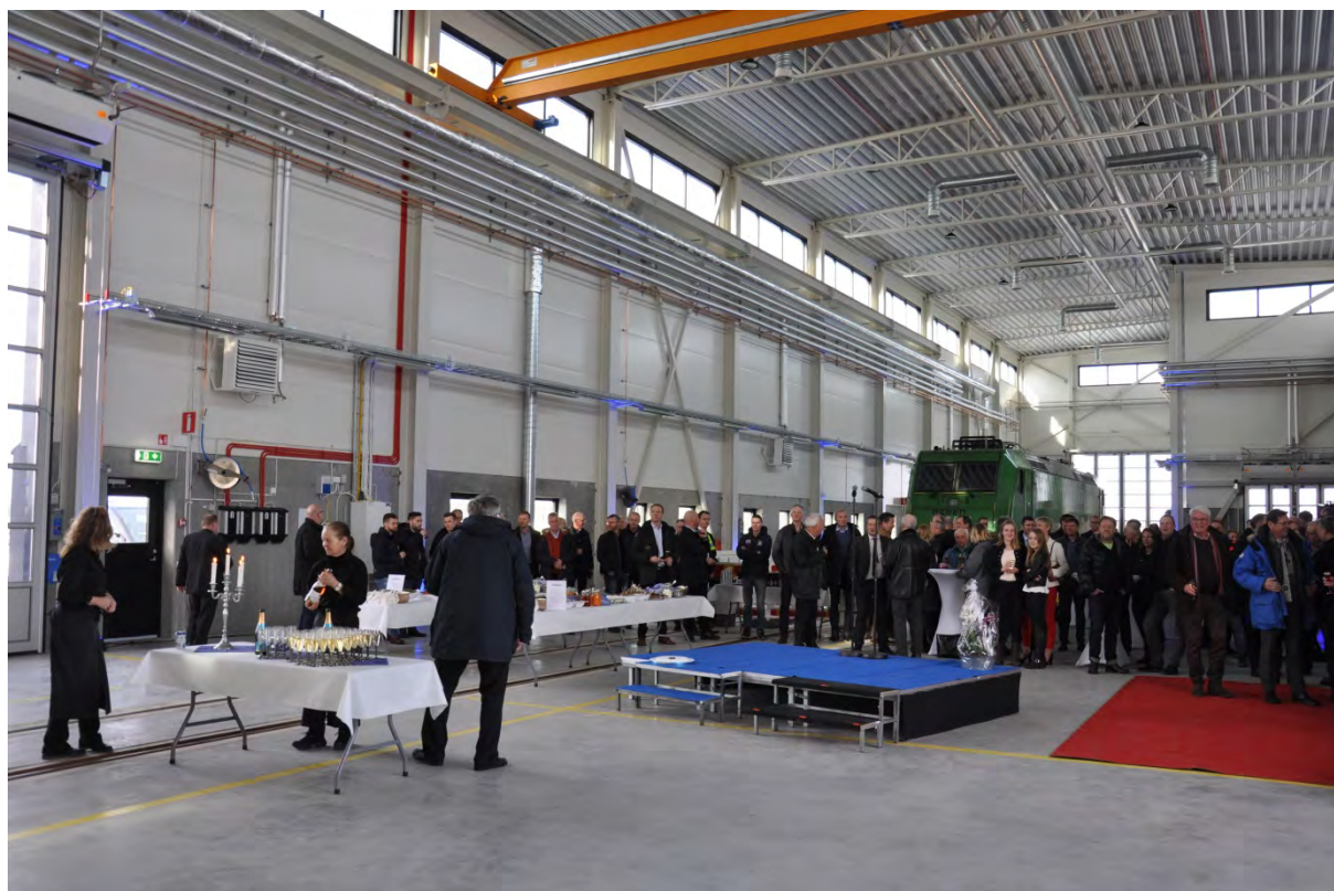
Bild 4. Gästerna väntar på att invigningsceremonin skall starta.