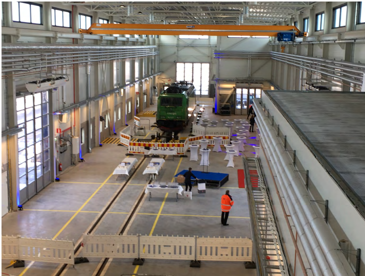
Bild 2. Tågserviceanläggningen ställs i ordning inför invigningen och första loket har kommit på plats, vilket var GreenCargos Re 1437 Traxx som står uppställt vid lokarbetsplatsen.