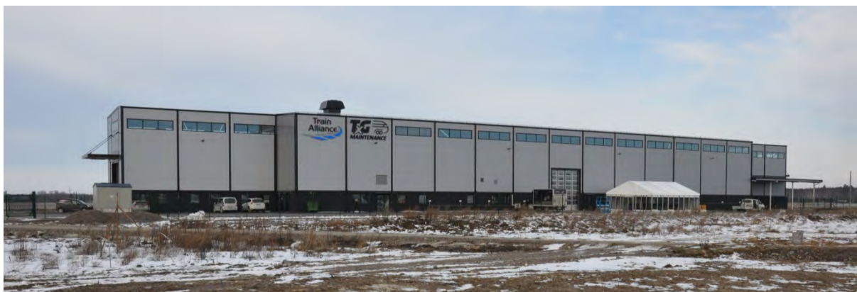
Bild 1. Anläggningen i sin helhet på invigningsdagen. Byggnaden är c:a 120 m lång och har en brutto area på 1 859 m 2 .

I byggnadens förlängning på ömse sidor finns långa spår som hinderfritt klarar uppställning av fordon om drygt 200 m längd, vilket är en framtidssäkring inför nästa generations motorvagnsfordon. Valet att även dimensionera hela anläggningen för största tillåtna axeltryck om 25 ton är också en investering för framtiden, då vi inom inte en allt för avlägsen tid troligen kommer att se nya tyngre lok för TEN-nätet ( Trans-European Networks ).