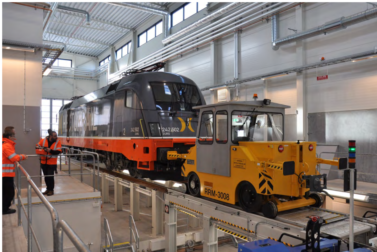
Bild 3. Det andra loket på invigningsdagen var Hector Rails 242 502 Taurus.